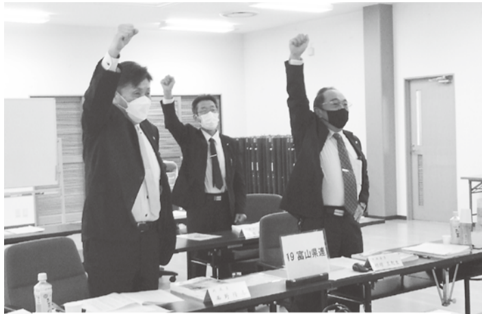
スクリーンに向かってガンバロー三唱(県連会館会議室会場)

全建総連は、10月15日に「新型コロナを乗り越え、組織拡大とCCUS促進の力で賃金・単価の引き上げ、魅力ある建設産業を実現しよう」をメインスローガンに第62回定期大会を開催した。