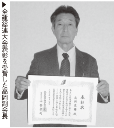
全建総連大会表彰を受賞した高岡副会長